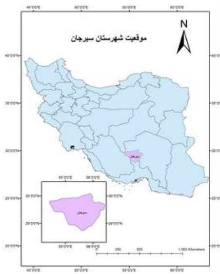
شکل ۱. موقعیت شهرستان سیرجان روی نقشه