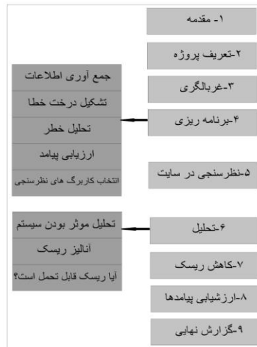
شکل ۳. فرآیند ارزیابی ریسک در سدها به روش RAM-D [۱۳]

روش RAM-D از روش تحلیل درخت خطا بهره می‌گیرد و اطلاعات مورد نیاز را از متخصصان، منابع موجود و سایت‌های اینترنتی فراهم می‌کند و طرح و نقشه اولیه سدها به شدت بستگی به این موارد دارد. RAM-D فرآیند زنده و پویا است که با تغییر محیط تهدید نیاز به بازبینی و تغییر دارد [۱۳]. در شکل ۳ مراحل اجرای ارزیابی ریسک به روش RAM-D نشان داده شده است.